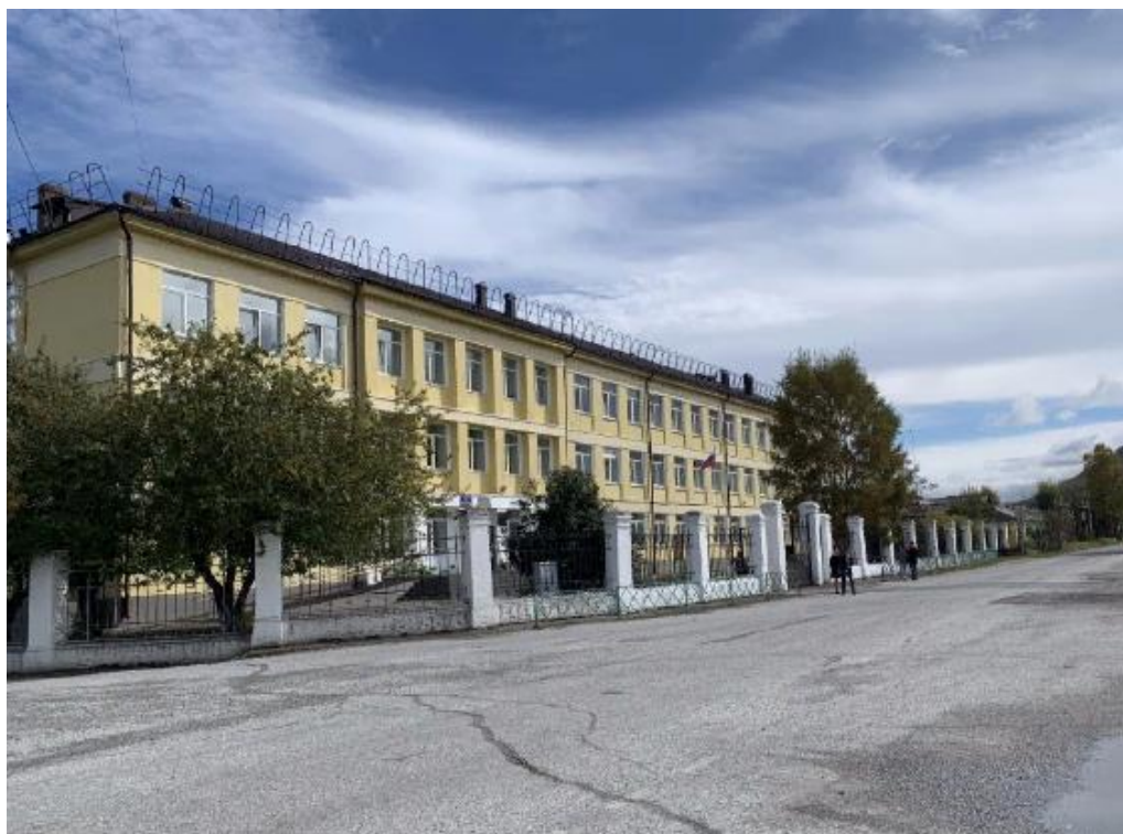
Подход с улицы 40 – лет Октября