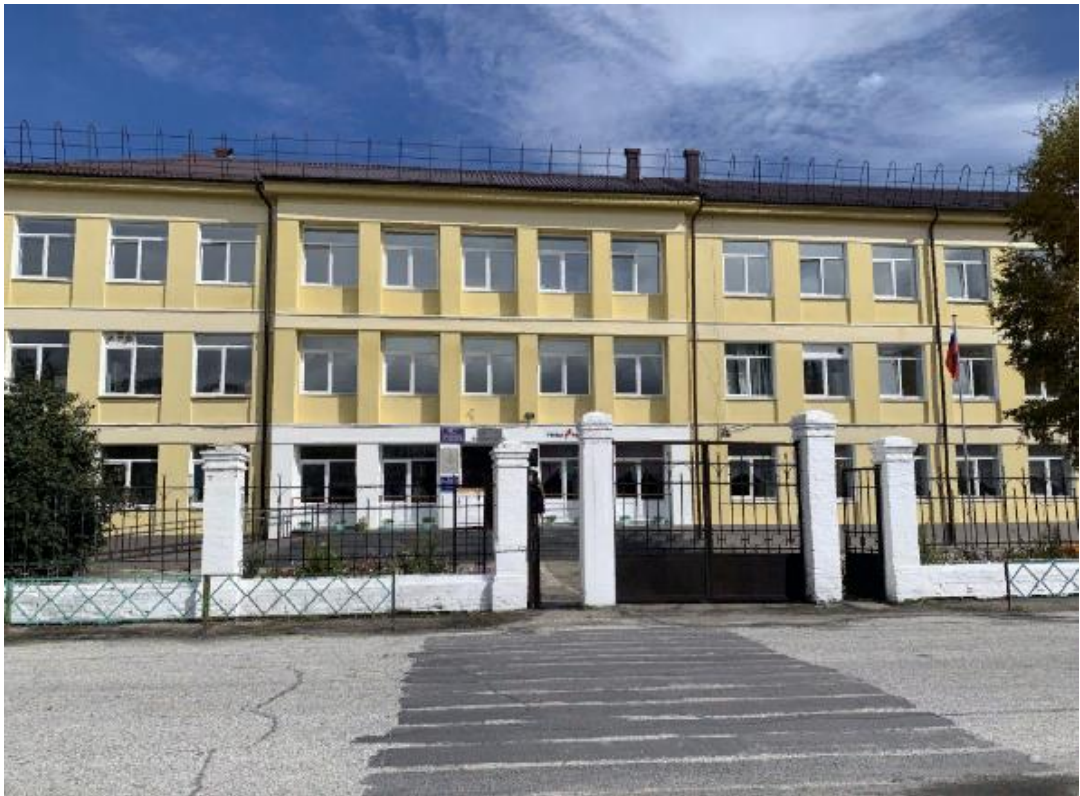
Подход по улице Тонконога с восточной стороны