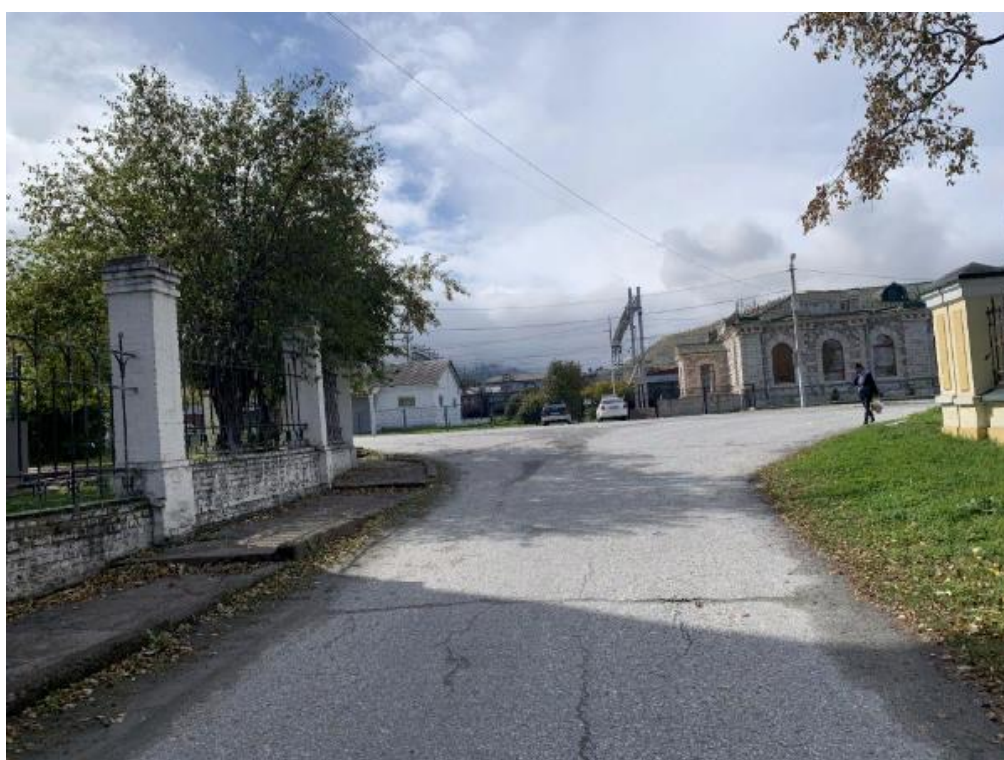
Вход в школу